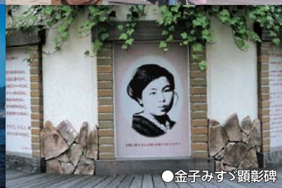
●金子みずゞ顕彰碑