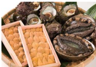
●うに・アワビ・サザエ