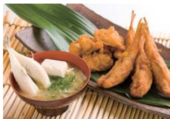
●ふくの唐揚げ・ふく汁