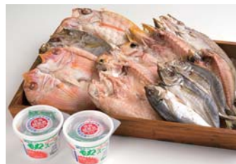
●もずくスープ・干物