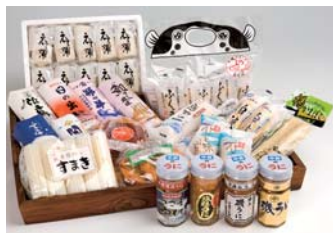
●ちくわ・蒲鉾・うに