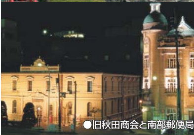
●旧秋田商会と南部郵便局