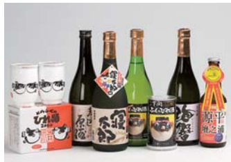
●下関名酒・ひれ酒