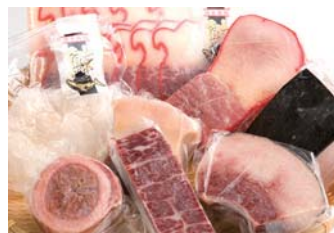
●鯨ベーコン・尾の身