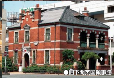
●旧下関英国領事館